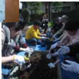
苗作り いきいきセンターや老人クラブの皆さんもご協力いただき配布用の苗を作りました。