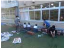
開晴館小学校 環境委員会の生徒さんが中庭で栽培。沢山になりました。