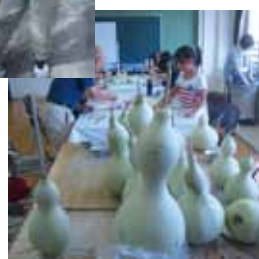
実の加工ワークショップ いきいきセンターで、実の加工や工作のワークショップのお手伝いをしました。