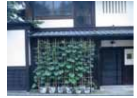
京町家の宿でも 立派な緑のカーテンになりましたが実はありませんでした。