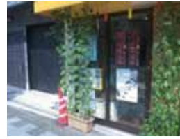
お店や事務所前でも いろいろな所で見かけると嬉しいです。