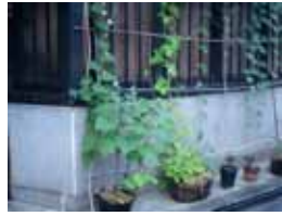
ご自宅前でも 鉢植えで栽培。実もしっかりなっていました。