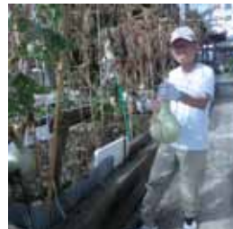
実の収穫 メンバーやワークショップ参加者さんと沢山収穫しました。