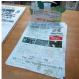
種の配布 区役所や地域のお店で種の配布をしました。種を個袋に詰める作業もみんなでした。