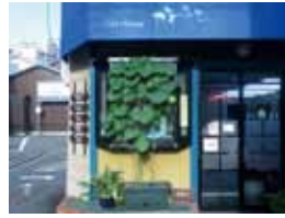
お店でも ウィンドーや外壁で栽培。大きな実がなっていました。